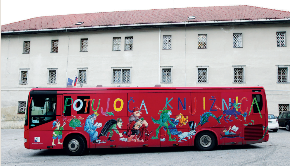
La Biblioteca Móvil de Ljubljana frente a la institución penitenciaria para mujeres

distintos tipos de material, como libros, DVDs y CDs. Igualmente, existe la opción de tomar los materiales por un período de préstamo extendido de 75 días.