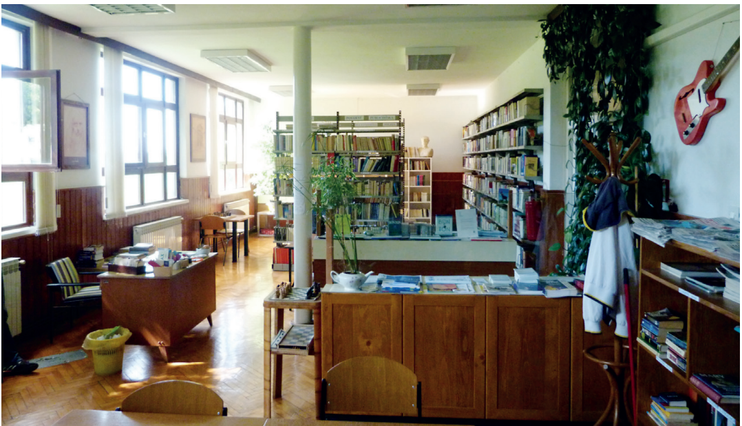
Biblioteca de la prisión de Valtura, Croacia

Se autorizará a todo recluso en espera de juicio a que se procure, a sus expensas o a las de un tercero, libros, diarios, material de escritura y otros medios de ocupación, dentro de los límites compatibles con el interés de la administración de justicia y la seguridad y el buen orden del establecimiento penitenciario.