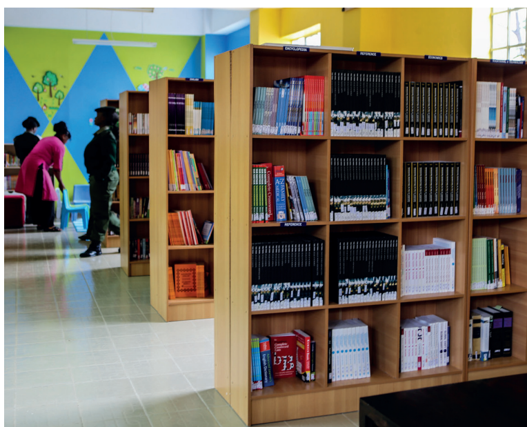
La Biblioteca para Mujeres y Niños Jones Day, en la prisión para mujeres Lang'ata, en Nairobi, Kenia

Una biblioteca penitenciaria debería, idealmente, ofrecer un rango de servicios de extensión correspondientes a las necesidades educativas, informativas y recreacionales de sus usuarios. Simplemente dar acceso a materiales de lectura físicos y digitales no es suficiente para sacar partido de las capacidades y oportunidades que una biblioteca penitenciaria puede proveer; algunos servicios de extensión pueden ser, por ejemplo, círculos de lectura y biblioclubes, grupos de escritura creativa (incluyendo poesía y cuentos cortos), de debate, visitas de autores, presentaciones de poesía y música y talleres de teatro.