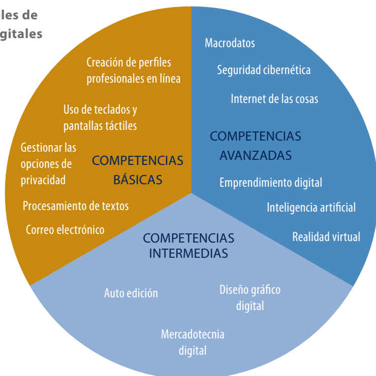
Gráfico 3.2. Niveles de competencias digitales

En el Capítulo 1, proporcionamos el ejemplo de la Estrategia de Transformación Digital para África de la Unión Africana (2020-2030) para mostrar cómo una estrategia regional de TIC puede responder a la tendencia global de