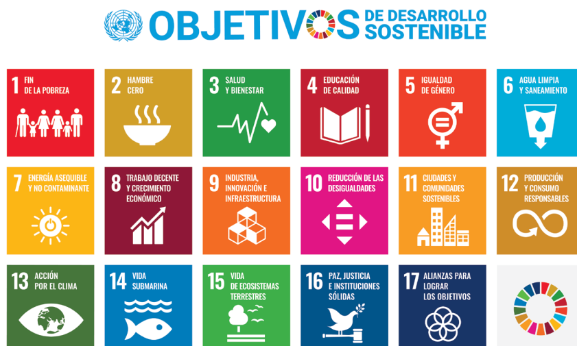
Gráfico 1: Objetivos de Desarrollo Sostenible

El ODS 4 insta a los países a “garantizar una educación inclusiva de calidad y promover oportunidades de aprendizaje a lo largo de toda la vida para todos” (Naciones Unidas, 2015, p. 19), dándole al ALTV un papel central en el desarrollo de políticas educativas para el desarrollo