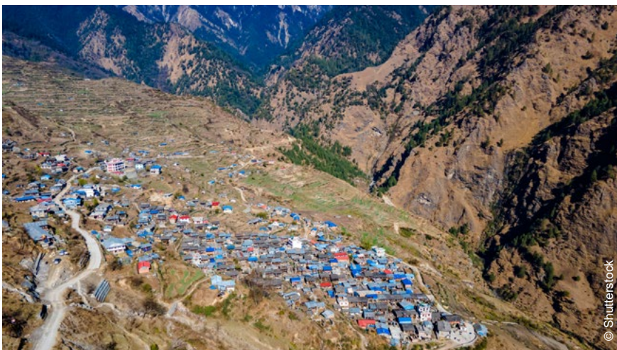
Vista aérea del pueblo de montaña de Gatlang, en Rasuwa (Nepal).