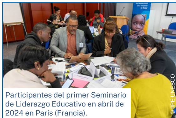
Participantes del primer Seminario de Liderazgo Educativo en abril de 2024 en París (Francia).

Impartido en colaboración con la Universidad Cheikh Anta Diop de Dakar, el programa inició su 18° cohorte en noviembre de 2024.